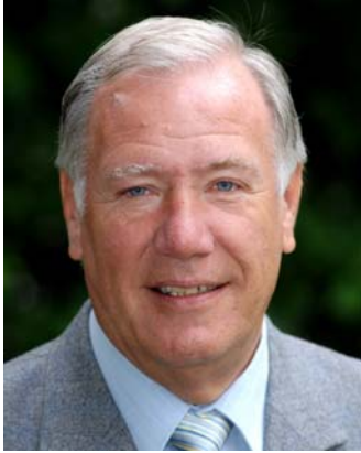
Joachim Schwidlinski Bürgermeister Wölpinghausen